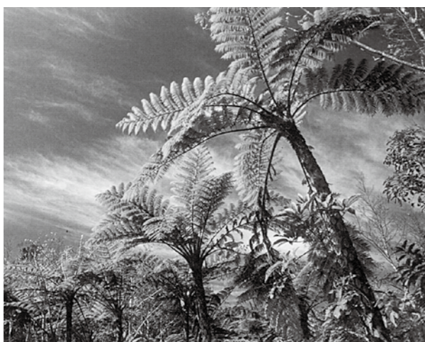
ヒカゲヘゴ= 湊和雄著『沖縄やんばるフィールド図鑑』より

温室の中に友人と二人で入り、歩を進めるほどに嬉しくなってくる。強烈な暑さと湿度の中で妍を競うカトレアの数々、胡蝶蘭などの洋蘭が咲き乱れる。十五メートルもある木性のシダ「ヒカゲヘゴ」だ。放射状に広がっている豊かで、シダ特有の葉を付けた巨大な幹には、測つたように点々と残る斑模様がある。これは