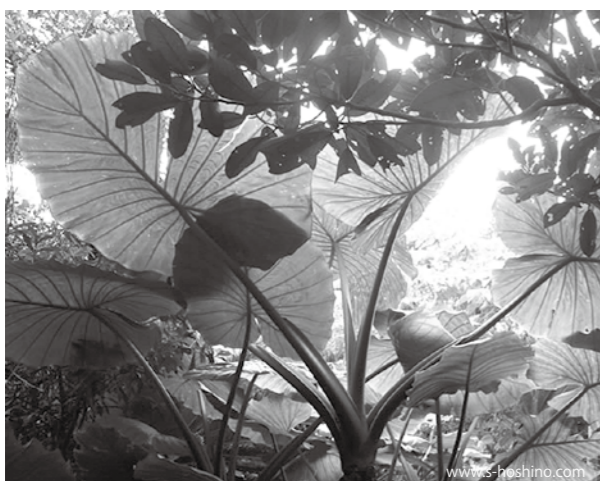
全長 3m にも成長するクワズイモ

渺渺とした大洋の水平と空の接点、右に目をやれば、ちゅうらうみはミニチュアのよう小さい。今日の午後早く、レセプションで夢中になって頬張った絶品のマンゴ味の味と、七十年前くるぐると海を埋め尽くしたという、アメリカ海軍の大艦隊の幻が、私の脳裏に不思議な不響和音を残して消えた。