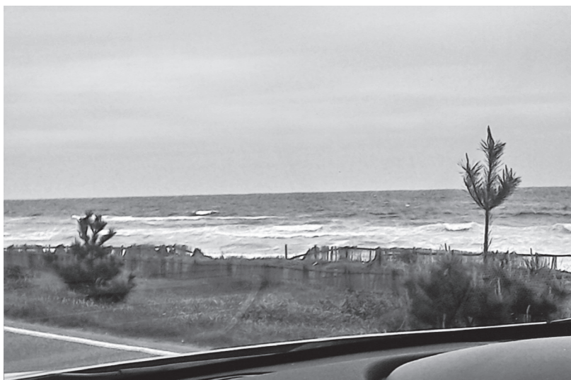
白兔海岸付近=国道9号上

既に定着していたと思える「アルビノ」だったのか？ どうでもよいことだけが私のシナプスを刺戟して困る。