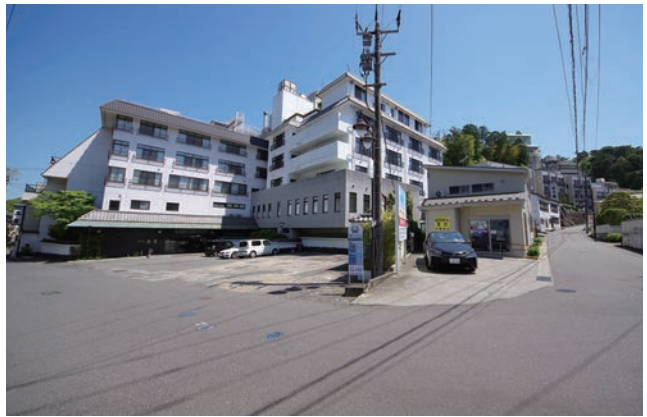
コロナ禍の今、市内の温泉旅館に泊まって旅行気分を味わいたい