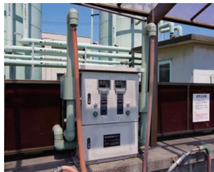
常磐支所でメダルを購入すれば、温泉が買える